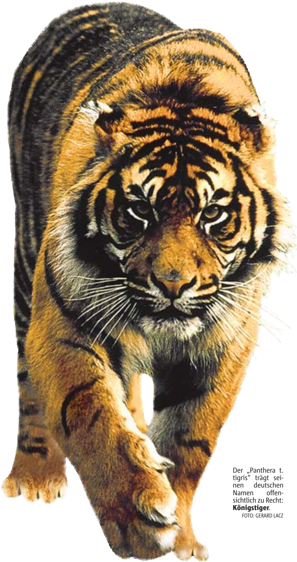
Der „Panthera t. tigris“ trägt seinen deutschen Namen offensichtlich zu Recht: Königstiger.

„Der Anblick eines Tigers kann die Seele verändern“