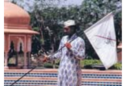
Am Pool des Oberoi-Hotels sind Tauben verboten. Mitarbeiter verjagen die Vögel mit Verbotsfahnen.

Es empfiehlt sich, nach Delhi zu fliegen, da es knapp 400 Kilometer von Ranthambhore-Sawai Madhoper entfernt ist (Mumbai ca. 1000 Kilometer). Diverse Fluggesellschaften (Aeroflot, British Airways, Austrian Airlines) fliegen mit Zwischenlandung von Düsseldorf nach Delhi (ab 650 Euro). Direktflüge von Frankfurt/M. nach Delhi gibt es von Air India oder Lufthansa (ab 1040 Euro). Von Delhi verkehren regelmäßig Super-Schnellzüge (z.B. Jan Shatabdi, Rajdhani) nach Sawai Madhoper (ca. fünf Stunden Fahrt).