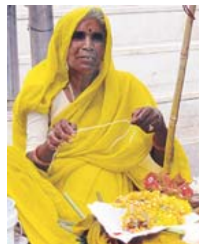
Viele Inder besuchen im Park die Tempelanlagen und decken sich hier mit farbenprächtigen Opfergaben ein.